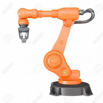
Dibujo 1: Brazo robótico industrial.